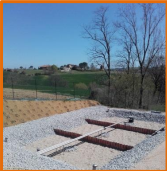
STATION D'ÉPURATION DU BOURG